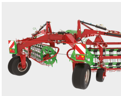
Sistema autosterzante. Sistema de autodirección.