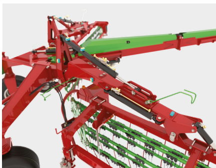
Regolazione idraulica dell'andana. Ajuste hidráulico del ancho de la hilera.